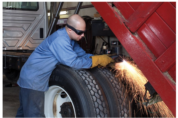
Reparación y modificación de vehículos