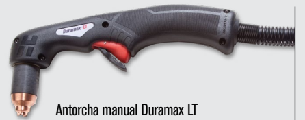
Antorcha manual Duramax LT